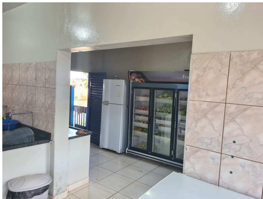
Anexo 12: Cozinha que vai ser reformulada para ser a despensa;