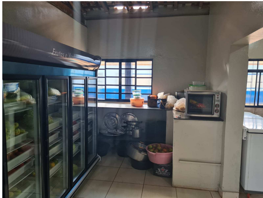
Anexo 11: Despensa que será demolida;