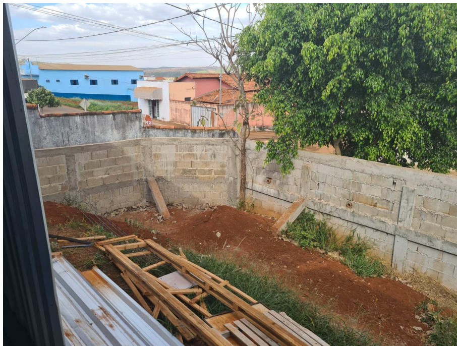
Anexo 08: Local onde será construída a cozinha;