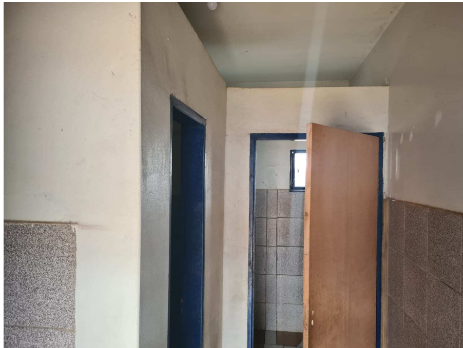
Anexo 03: Banheiro feminino a ser reformulado;