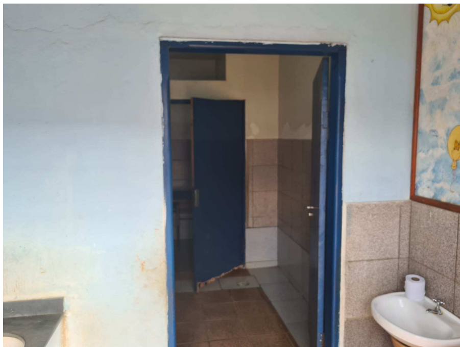
Anexo 06: Banheiro masculino a ser reformulado;