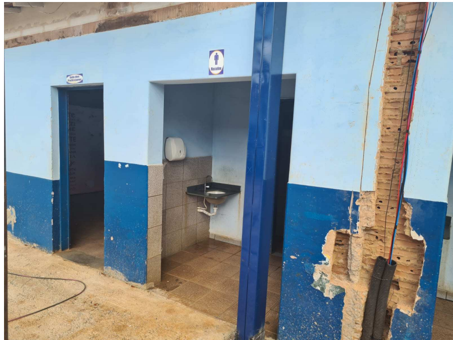
Anexo 05: Banheiro masculino a ser reformulado;