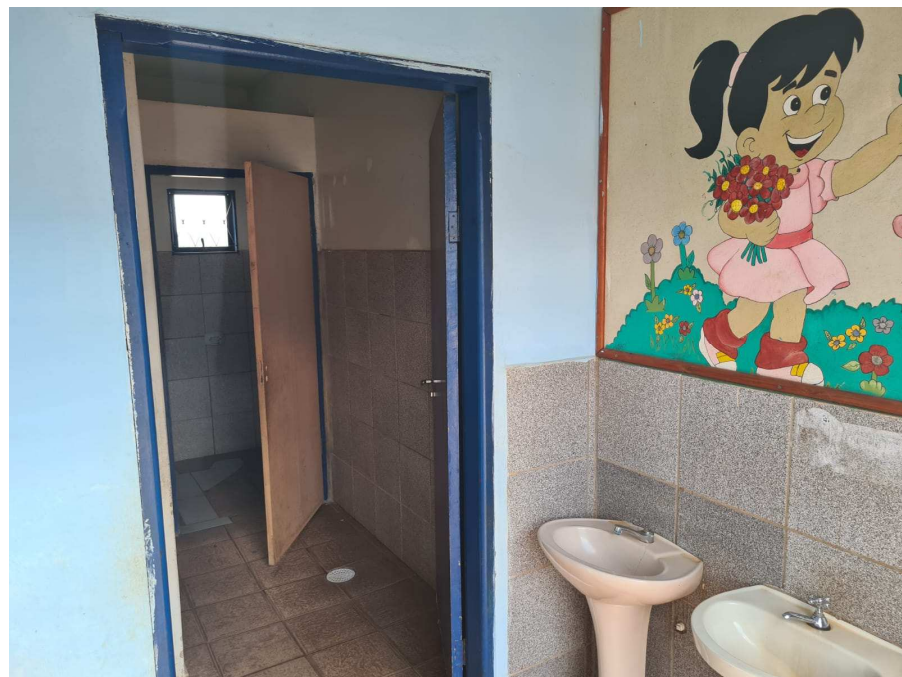
Anexo 04: Banheiro feminino a ser reformulado;