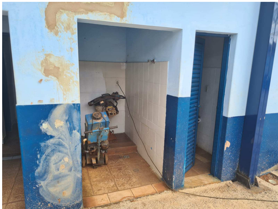
Anexo 01: Cômado onde fica o bebedouro;

OBJETO: CONTRATAÇÃO DE EMPRESA ESPECIALIZADA PARA AMPLIAÇÃO E REFORMA DA ESCOLA MUNICIPAL OLINDA MARIA DA CUNHA.