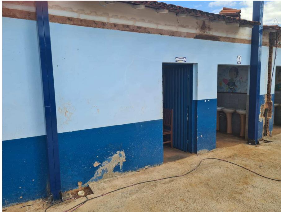
Anexo 07: Fachada da sala a ser reformulada e banheiro masculino;