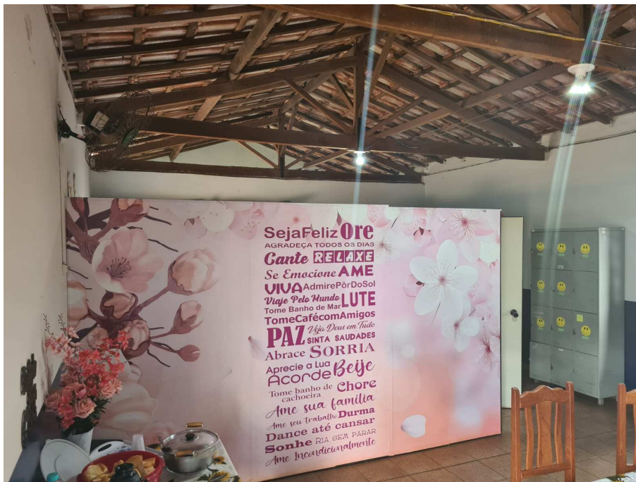
Anexo 14: Sala que será reformulada e dividida em duas;