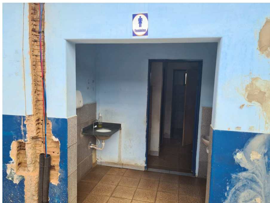
Anexo 02: Banheiro feminino a ser reformulado;