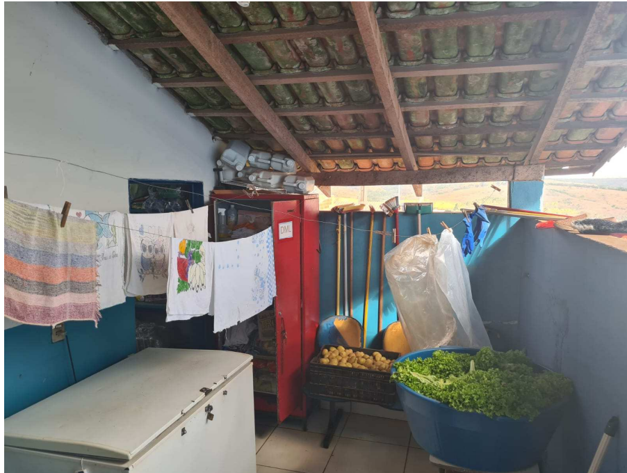
Anexo 13: Lavanderia atual;